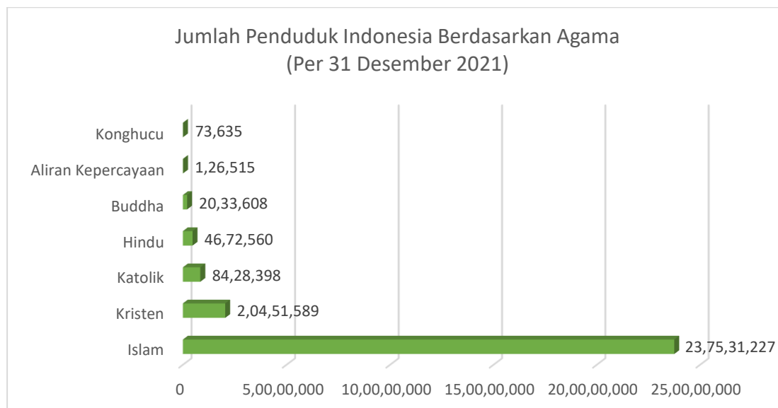
Gambar 1. Sumber: Kementerian Dalam Negeri (Kemendagri)

Situasi ini dapat dipadankan dengan kondisi yang ada di Indonesia saat ini. Agama Kristen yang merupakan salah satu agama minoritas secara jumlah penduduk seringkali mendapat perlakuan tidak adil. Merujuk pada data yang dipublikasikan oleh Kementerian Dalam Negeri (Kemendagri) di bawah ini, meskipun agama Kristen merupakan agama kedua berdasarkan jumlah pemeluk. Dan meskipun secara konstitusi agama Kristen diakui dan dilindungi negara. Undang-Undang Dasar Negera Republik Indonesia (UUD RI) 1945 telah memberikan jaminan konstitusional kepada setiap warga negara untuk memeluk agama dan kepercayaan dan menjalankan ibadah sesuai agama dan kepercayaannya itu. Berbagai produk kebijakan turunannya juga telah menegaskan jaminan sebagaimana tertuang dalam Konstitusi. UU No. 12/2005 tentang Ratifikasi Kovenan Sipil dan Politik, yang salah satu pasalnya memuat jaminan kebebasan beragama/berkeyakinan juga telah menjadi landasan bahwa produk hukum internasional itu telah menjadi bagian hukum Indonesia yang mengikat negara untuk menjamin dan memenuhinya. Namun demikian, jaminan konstitusional dan legal sebagaimana tersedia dalam perundang-undangan Indonesia belum cukup mampu memproteksi kebebasan dasar tersebut. Menjadi minoritas seringkali membuat diskriminasi bertambah, pemukulan, penganiayaan, fitnahan, bahkan termasuk mempersulit pembangunan rumah ibadah (gereja).