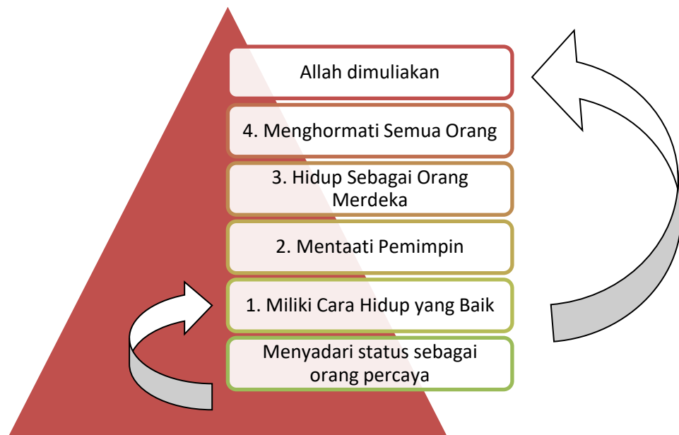
Gambar 4. Skema sikap orang Kristen

Berdasarkan pembahasan yang telah dilakukan maka sikap hidup orang Kristen dalam menjalankan kehidupan sehari-hari di tengah dunia ini, dapat digambarkan dalam skema berikut ini: